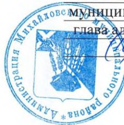
СХЕМА ТЕПЛОСНАБЖЕНИЯ МУНИЦИПАЛЬНОГО ОБРАЗОВАНИЯ СУНЯТСЕНСКОЕ СЕЛЬСКОЕ ПОСЕЛЕНИЕ МИХАЙЛОВСКОГО РАЙОНА ПРИМОРСКОГО КРАЯ До 2034 года