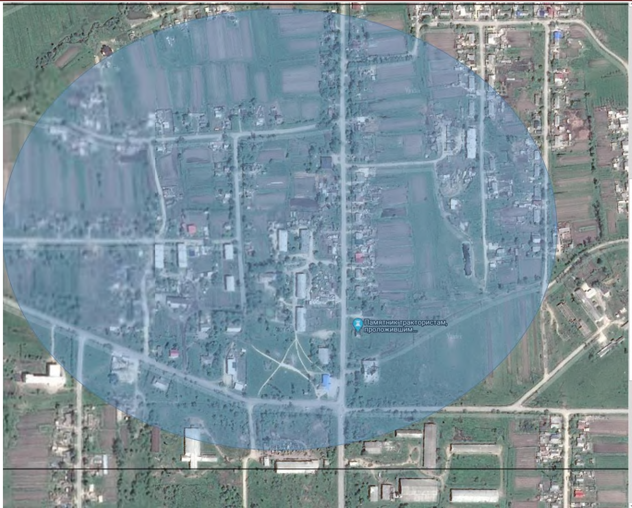
Рис. 2.1 – Зона действия теплоснабжения котельной № 1/9 села Первомайское