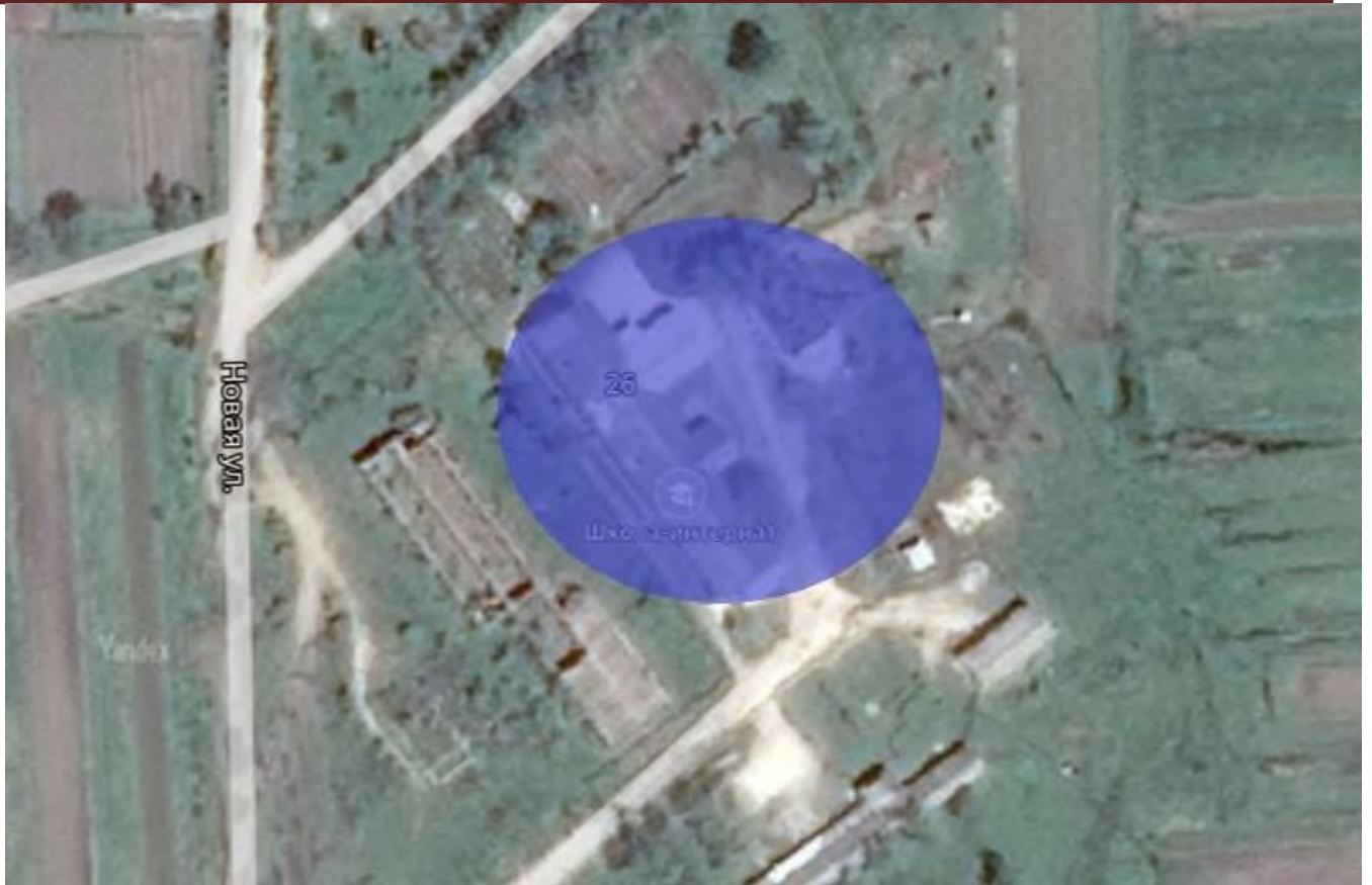
Рис. 2.2 – Зона действия теплоснабжения котельной КГОбУ Первомайской КШИ