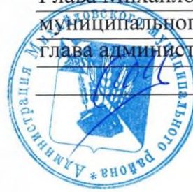
СХЕМА ТЕПЛОСНАБЖЕНИЯ МУНИЦИПАЛЬНОГО ОБРАЗОВАНИЯ ОСИНОВСКОЕ СЕЛЬСКОЕ ПОСЕЛЕНИЕ МИХАЙЛОВСКОГО РАЙОНА ПРИМОРСКОГО КРАЯ ДО 2033 ГОДА